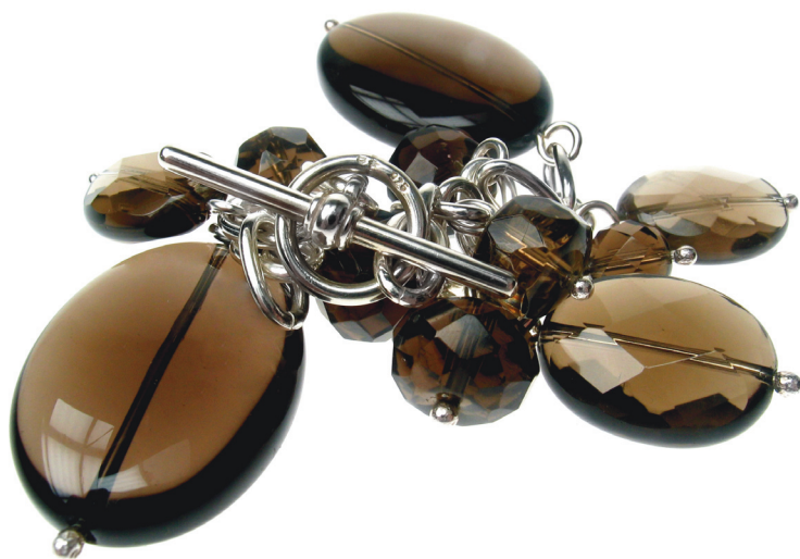
Charms Armkette in Silber 925 mit elf geschliffenen Rauchquarz-Perlen in einem wunderschönen, geheimnisvollen Braunton.