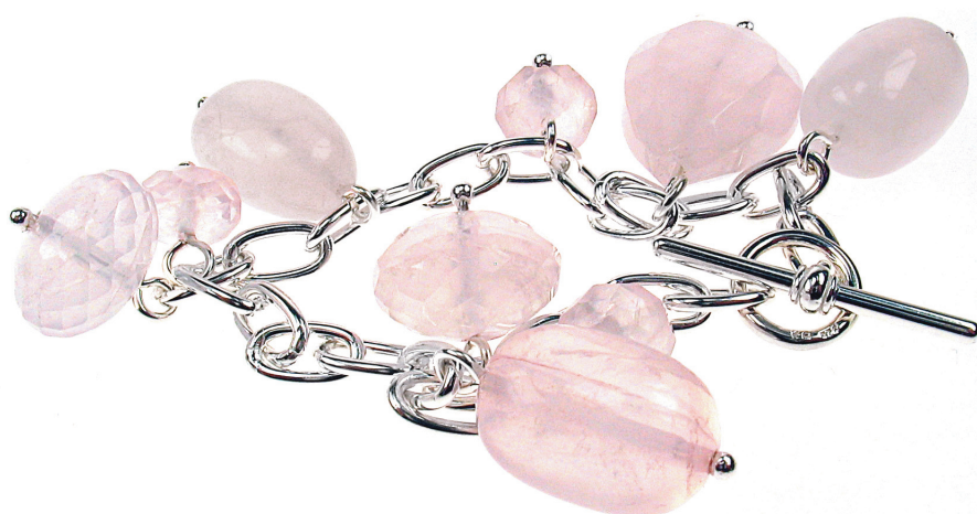
Charms Armbkette in Silber 925 mit neun geschliffenen Rosaquarz-Perlen. Ein verführerisches und sinnliches Erlebnis.