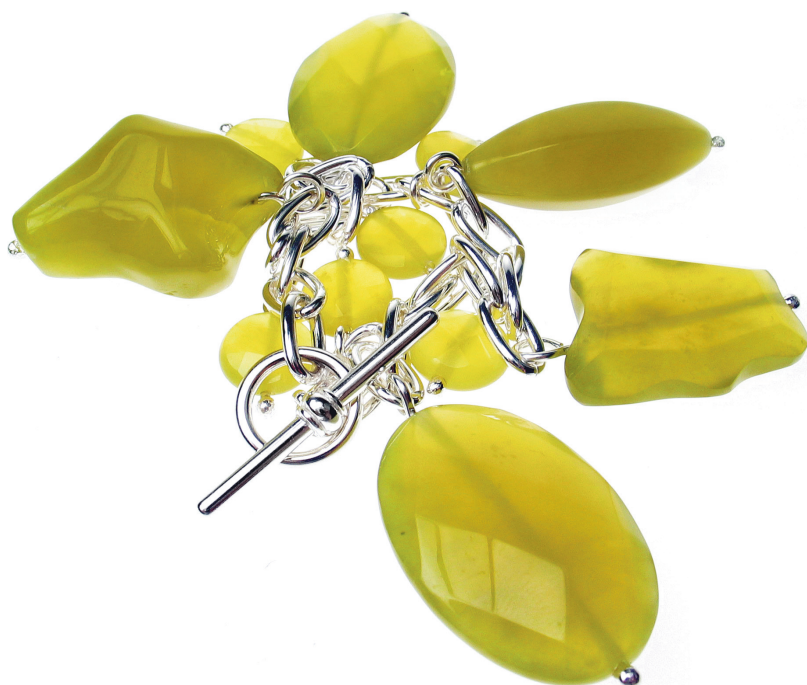
Charms Armbrette in Silber 925 mit elf geschliffenen Serpentin-Perlen in einem wunderschönen, erfrischenden Grünton.